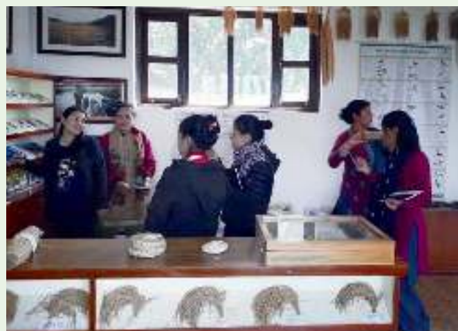
Medewerkers van ISARD krijgen uitleg over de zadenbank

Wel ziet ISARD dat zowel lokale gewassen als hybride gewassen hun voor- en nadelen hebben. Om lokale gewassen succesvol te introduceren in de landbouw is het belangrijk dat zij echt toegevoegde waarde hebben ten opzichte van de hybride gewassen. ISARD medewerkers zagen ter plaatse dat nog veel boeren hybride groentegewassen gebruikten voor hun landbouwproductie. Het lijkt er dus op dat de gemeenschappen niet alleen maar lokale zaden gebruiken voor de landbouw, ondanks de inspanningen van LI-BIRD. Een les die ISARD hieruit trekt is dat het belangrijk is om de boeren te leren wat de kwaliteiten van lokale gewassen zijn, zodat zij zelf een keuze kunnen maken wat zij het beste kunnen verbouwen.