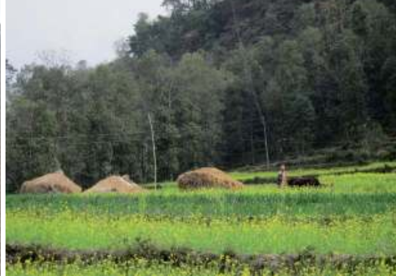
Als contrast, dezelfde dag genomen als Phulpingkati, een foto van de groene velden nabij ISARD office