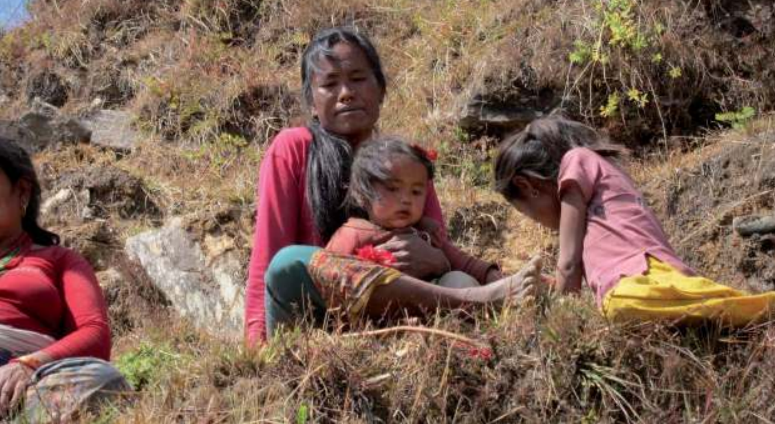
Dorpelingen van Mankha