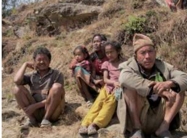
Dorpelingen uit Mankha, die in het begin argwanend waren jegens ISARD

planten van timur (Sechuan pepers) omdat de zwijnen de mais vernielden.