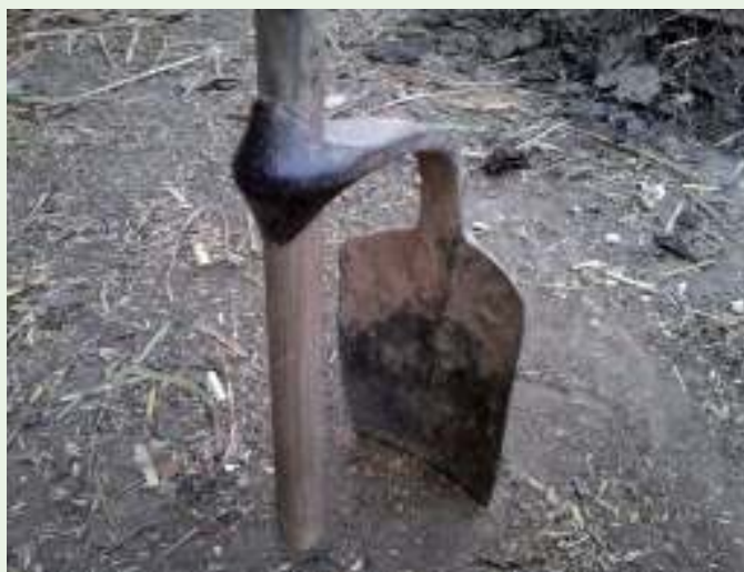
Kodali, gebruikt om de grond mee open te breken

Naast de kleinschaligheid zijn er wel meer omstandigheden die niet bevorderlijk zijn voor de mechanisatie van de landbouw. De rentepercentages op de leningen om de machines te kunnen aanschaffen zijn hoog in de afgelegen gebieden. De neiging bij boeren om te investeren in landbouwmachines is daarom niet groot. Andere beperkingen liggen in de mate van beschikbaarheid van reserve-onderdelen en het krijgen van een adequate training voor het gebruik en het onderhoud van het materiaal.