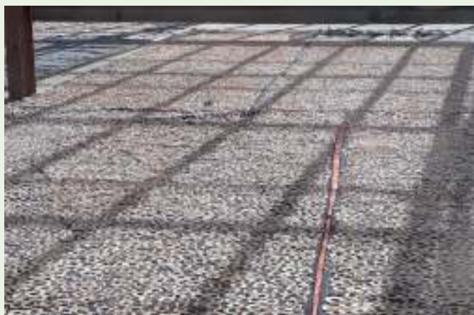
Appelschijfjes die in de zon worden gedroogd

De medewerkers van ISARD zijn een essentiële schakel in de integrale dorpsontwikkeling die ICFON nastreeft. Zij verzorgen in de dorpen de trainingen aan de boeren en leren hen om het land beter te bewerken, welke verschillende gewassen zij kunnen verbouwen en hoe zij deze gewassen op de markt aan de man moeten brengen. Gedurende het hele jaar zijn met name de JTA's, de Junior Technicians in Agriculture, hier heel druk mee. Eind oktober was het tijd voor de ISARD medewerkers om zelf weer eens getraind te worden, zodat zij hun nieuwe kennis kunnen overbrengen in de dorpen.