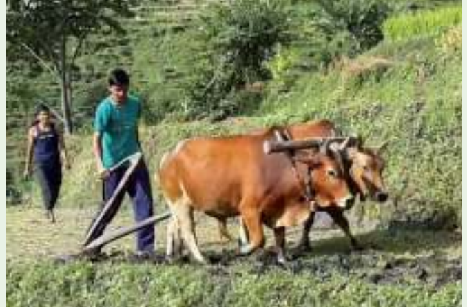
Ploegen met twee ossen