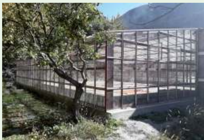
Kas om appels in te drogen

LI-BIRD heeft een informatiecentrum in Sundar Dada, met een prachtig uitzicht over de nabijgelegen bergen