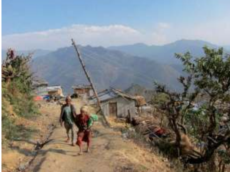
Dorpelingen uit Mankha op weg naar het land

ken. Hij legde uit waarom we daar waren en wat we van plan waren. Nu zijn er vier groepen en alle leden daarvan doen mee met het werk van ISARD in het dorp. De gemeenschap is heel anders dan wat we in andere dorpen hebben meegemaakt. Als een dorping zaden of stekken krijgt dan willen alle huishoudens die ook hebben. Zo niet, dan ontstaan er problemen en conflicten in het dorp. Twee dorpsbewoners die niet vrijwillig wilden meehelpen aan het werk voor de reconstructie van de watervoorziening, werden uit de groep gezet. Alles in het dorp gaat op basis van gelijkheid. In voorgaande projecten kenden we materialen e.d. toe aan aangewezen personen. Daarin ligt in Mankha dus nog een hele uitdaging!