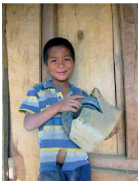
Een jongen uit Salleri