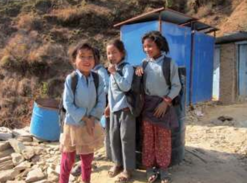
Meisjes uit Mankha, die terugkomen van school