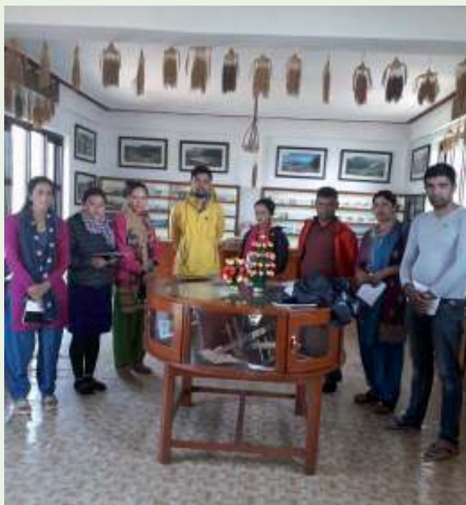
Groepsfoto van ISARD medewerkers

en de Rupa en Begnas meren. Op de tweede verdieping van het gebouw is de zadenbank. Hierin zitten alleen zaden die lokaal verkrijgbaar zijn. De medewerkers van ISARD hebben daar geleerd dat LI-BIRD data over de lokale biodiversiteit verzameld. Tot nu toe zijn 63 verschillende soorten rijst geïdentificeerd. Andere gewassen in de zadenbank die de medewerkers tegenkwamen zijn gerst, tarwe en gierst. Afgezien van de landbouwgewassen heeft LI-BIRD ook de verschillende soorten orchideeën, witte lotussen, vogels en vissen in de regio in kaart gebracht.