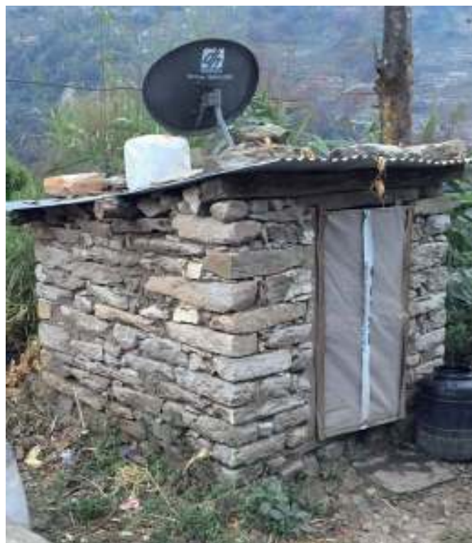
Toilet bij projectgebied ISARD

De huidige toiletechnologie waarbij spoelbakken met drinkwater worden gebruikt (vooral in de grotere plaatsen) om door te trekken, kost zeer veel geld en water, vooral in de steden van Nepal die te kampen hebben met een chronisch watertekort. Ingenieurs over de hele wereld experimenteren met de volgende generatie toiletontwerpen, waarmee uitwerpselen kunnen worden verbrand en omgezet in waardevolle energiebronnen. Echter zo ver als Westerse landen is Nepal nog niet, maar het zou een mooi streep punt zijn om te werken aan betere hygiëne, zodat er minder ziektes voorkomen veroorzaakt door een gebrekkige hygiëne.